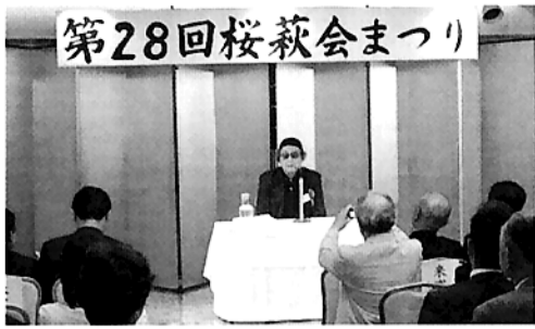
第28回桜萩会まつり

二十八回・桜萩会総会(六月祭)が盛大に開催されました。当日は、来賓の方々を含め約百二十名が集い、久しぶりの旧交を温めました。