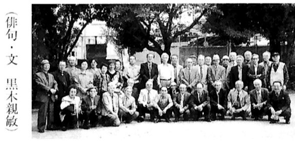
(俳句・文 黒木親敏)

「ひふみ」の皆さん約四十名。しめやかに野の百合手向け字後の忌去る五月八日、高校グラウンドの一角に建つ動員学徒殉没者之碑の前で慰霊祭が行われた。集まったのは、旧制小林中学二十三回生で新制小林高校一回生の同窓生で作る「ひふみ」の皆さん約四十名。