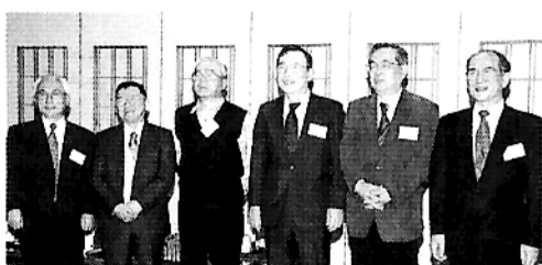
高千穂会歴代会長勢揃い

今年三月の誕生日で満六十才となり三十八年間勤務した職場を定年退職しました。振り返ると、この間多くの方々と出会いが有り今日の私の人間形成に影響を受けているのを感じます。消極的で人見知りする私が金融機関に就職し、否が応でも人との対話が重要で当初は苦痛に感じていましたが、自分の個性を出す事により対話も苦痛と感じなくなりました。近畿地区には九州出身者も多く訛りで得した事も数多く有ります。又、平均三年程度で転勤し慣れた環境から新しく人間関係を築いて行くのは苦痛でしたが、プラス思考で切替えて新しい人との出会いを楽しみにするようにな