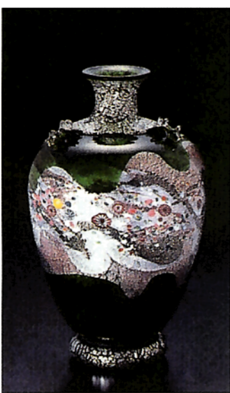
花器 プラチナ象嵌「光琳」