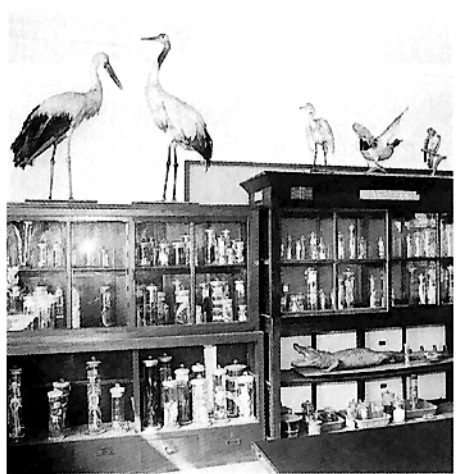
記念行事があった頃と思

「コウノトリ」と「タンチョウヅル」。間近で見ると大きいものだ。違いもよく分かる。北校舎の生物教室内に