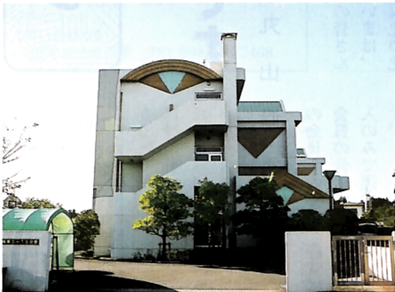
生徒寮全景と食堂(下)