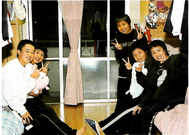
寮室でくつろぐ女子駅伝部の皆さん

寮には、県外からの生徒も多い。アスリートとしての資質を育てると同時に、食事をはじめとする生活面や、精神面での手助けを担う大切な部署である。 生徒たちは、「時間に追われる厳しさはあるが、毎日充実していて楽しい。」と語る。 記者に対する寮生の笑顔が、それを裏づけていた。