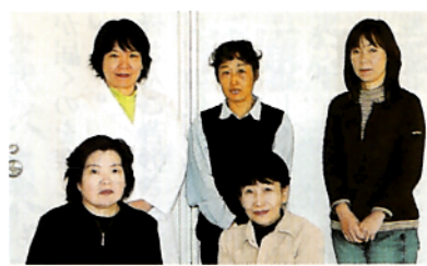
寮スタッフの皆さん

体育コースに、生徒寮が完成したのは平成10年。冷暖房完備の3階建。80人収容の食堂。30畳の談話室。ミーティングルームがある。部屋は、机・ベッド・ロッカー付の2人部屋。 11月の時点で、87名の寮生が生活していた。3人の寮母、栄養士1名を含む10人の厨房スタッフ。そして毎日2人ずつ宿直にあたる先生方。夕方の