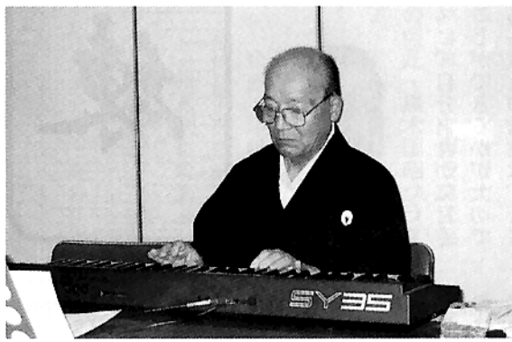
【旦早流のHP: http://WWW.tansou.com 】

が、当時の音楽部で、男は僕を入れて二人だけでした」と笑う。「将来は音楽の道に進もうと思った