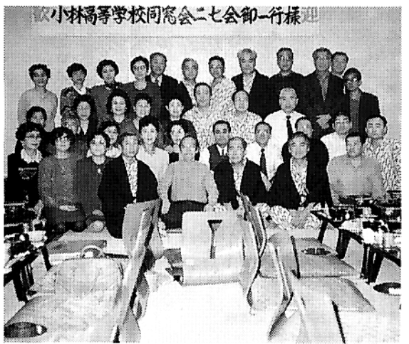
小林高等専門学校同窓会二七会御一行様

今年春は早くも、二七会は小林と関西、遠くラジルから友を迎え三十七名が箱根湯本のパークス吉野に二月六・七日に会合した。昭和二十七年に卒業した高4回生は終戦の翌年に旧制中学校・女学校に入学し