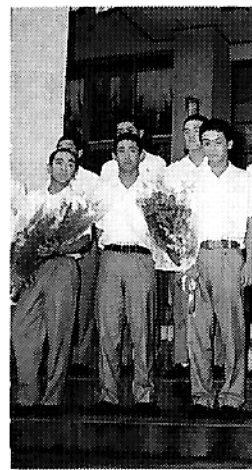
小林西高校野球部ナイン

清涼の候、益々ご清栄の事とお慶び申し上げます。さてこの度、本校野球部が第七十五回全国高校野球選手権記念大会に宮崎県代表として出場しました。これは、多くの方々に物心両面