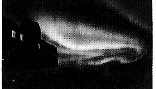
カーテン状のオーロラ

日本の夏至を中心としたおよそ四日間、太陽が顔を覗かせない。昼には、北の空がほんのり明るくなるが、再び長い夜が訪れる。極夜である。逆に、日本の冬至の頃には、白夜が続く。真夜中も太陽が輝く。観測船「ふじ」に乗り、越冬生活したのは、もう十五年以上も前のことだ。様々な観測や研究を目的に、ない日もある。こんな時の気温は、氷点下十度程度と暖かいが、風が強いので体感温度は下がる。快晴の風が弱く、放射冷却現象で氷点下四十度。まさに厳寒の地であり、油断すると死神が招く。