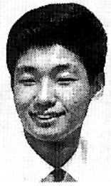
17歳の時、シドニーで

私は三回、延べ五年半の海外生活を経験した。最初、小林高校在学中の一九六二年にロータリークラブの交換青年としてシドニーに、二回目は一九七二年から七三年までフランス政府の給費留学生としてドイツの国境に近いストラスブールに、そして三回目は一九八七年から九〇年まで国際協力事業団の専門家としてインドネシアの首都ジャカルタに居住した。