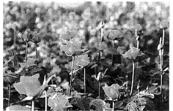
▲バラ園ブルーミングローズ