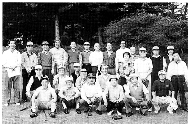
桜萩会スポーツ文化部ゴルフ同好会第14回ゴルフ大会 平成8年10月6日、塩原C.C.

去る十月六日(日)に第14回ゴルフ大会を栃木県の塩原カントリークラブで開催しました。参加者は26名(7組)で、前日の「幸ノ湯温泉」での前夜祭では西諸弁が飛び交い、おおいに盛り上がりました。 当日は、台風の影響で中止となった昨年とは打ってかわって好天に恵まれまし