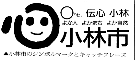
▲小林市のシンボルマークとキャッチフレーズ

「(わ) 伝心小林・よか人 よかまち よか自然」によるシンボルマークなど決定 「まちづくり」推進