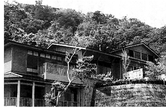
リニューアルした白鳥温泉の施設