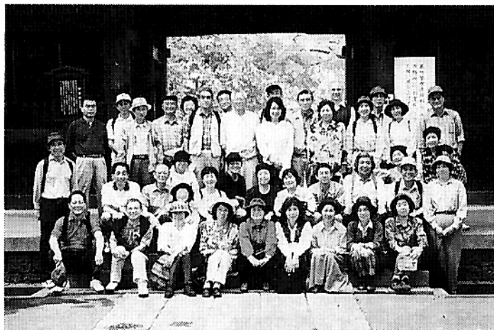
自由ヶ丘九品仏浄信寺にて (H8年10月13日)

今年最後のウォーク「杉並コース」(十一月八日)の下見を本日してきたところ このコースは西武新宿線の新井薬師前駅から京王線の西永福駅までの九kmで、これまで一番長いですが、今年の取を飾ることがわかりましたし、これまでに感じたのは、住まいの近くと通勤先のまわりだけだったですが、今では都内かなりの区まで親しみを感じるようになりました。 来年も三月からスタートします。興味のある方はご連絡ください。 電話03-3852-104 72(永迫まで)