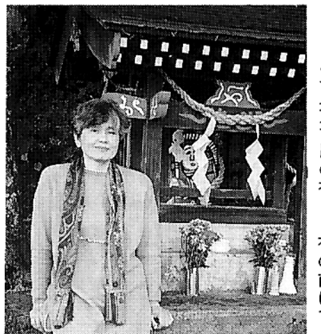
えびの市永永、田の神さあ祠の前にて