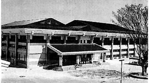
完成した高原中学校の体育館