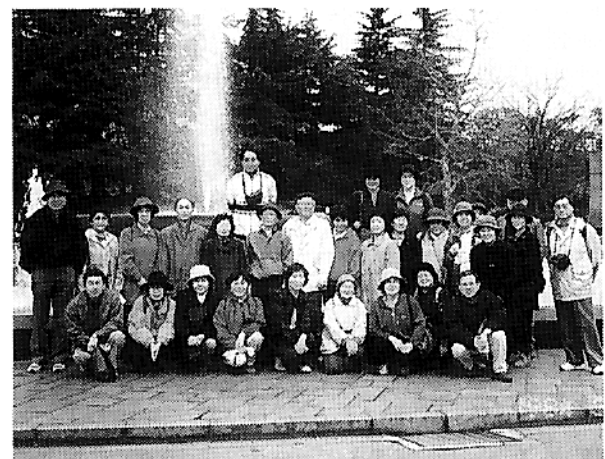
平成10年3月21日、日比谷公園にて

させたいものです。この道の目的は「歩く」ことによって、自然や歴史や人情など、その土地の本當の魅力にじかにふれてもらうことにあります。 この道の発想の原点は、関東地方知事会の席上での「一都六県が手を結んでできる仕事は何か」という問題提起から始まって、推進されたといわれております。それから十数年後「手ならぬ足で一都六県が見事に結ばれた」と当時のマスコミは報じております。 手始めとして、六月十三日(土)に高尾山(五九九m)に登ります。ゆっくり登りますので、健康な方ならどなたでも歩けると思