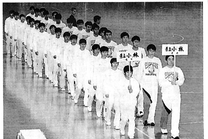
平成9年度全国高校バスケットボール選抜優勝大会

スポーツ文化部は、「母校バスケット部の全国大会の応援」を充実させようとの提案から発足したわけですが、現在はこれに加え、「ゴルフ同好会」、「歩こう会」の3部会で活動しています。 さて、母校のバスケット部は、男女ともに県で実力ナンバー1、昨年末の全国大会に女子は15回目(8年連続で過去優勝1回)、バスケット部は2回、男子は3回目(3年連続)の出場を果たしました。