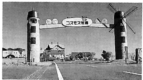
自然とふれあうコスモス牧場

また、昨年名譽場長として、小林市出身で女優の斉藤慶子さんに就任いただいたスクリーン販売、中小家畜とのふれあい広場、ポニーの乗馬場、スーパースイ