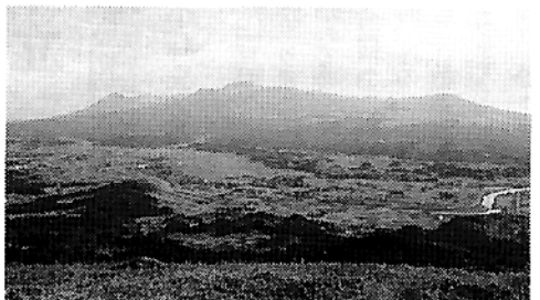
矢岳高原から望む霧島連山