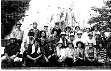
日光・湯滝前にて

「歩こう会」もこの十二月でまる四年(31回開催)となりました。初年度から参加の半数近い皆さんのご