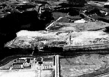
▲高原町の新工業団地