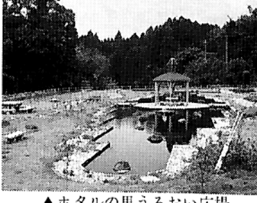
▲ホテルの里うるおい広場

◆ 世の中は不景気一色で、なかなか展望が開けないが、みなさんから寄せられた数多くの原稿を見て、同窓会の絆(きずな)が心強く感じられる。