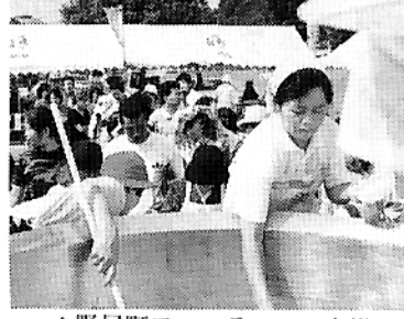
▲野尻町フェスティバル会場