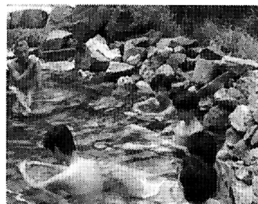
▲えびの市営露天風呂

出の山ホテルの里にうるおいの広場完成！ ふるさとの宝、出の山名水とホテル、雄大な霧島連山のすそ野に広がる小林市。豊かな水とともに多くの生命を育んでくれている出の山公園の湧水は「全国名水百選」にも選ばれ、ホテルの名所としても有名です。ここには、淡水魚展示せらぎ水路、ハツ橋東屋等自然環境に配慮したホテルの建設が完成しました。 出の山一帯は、六十種類以上の植物が自生する自然の宝庫となっています。毎年ホテルの最盛期には数万匹のホタルが乱舞、県内外から