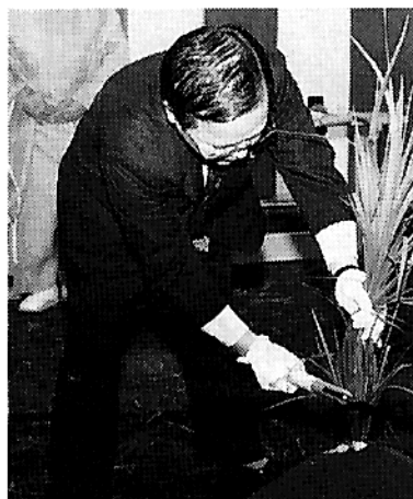
総合交流ターミナル起工式(町長)