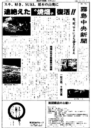
月刊霧島中央新聞第5号

「月刊霧島中央新聞」です。この新聞は、西諸の人々と高橋を卒業。放浪の末、東京中央区にある日本証券新聞社に入社。仕事柄東京証券取引所通いの毎日でした。西諸舟にこだわる本質的田舎人間の私は、足かけ二十年で退社。昨年三月に家族五人で帰郷しました。元氣な内に、あのダンボ