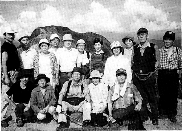
磐梯山8合目お花畑にて