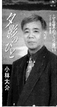
ヒットCDジャケット

また、本年十二月十一日は、中野ゼロホール(一、三〇)名収容にて、コンサートを開催し、桜萩会の皆様