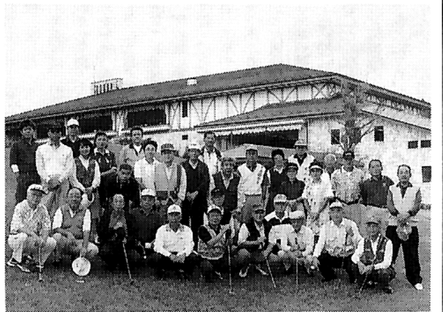
太平洋GC御殿場ウエストコースにて