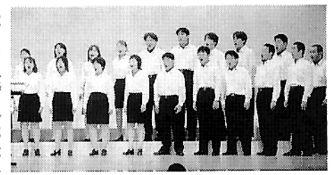
▲第48回全国青年大会、演劇・合唱部門で最優秀賞を受賞

三年、平成三年まで四年連続の優勝(通算12回の優勝)を飾るなど、スポーツ分野で活躍。平成五年から活動の幅を文化活動にも広げ、平成六年、八年、十年、十一年まで全国青年大会で通算5回の最優秀賞を受賞(全国最多の受賞回数)。平成九年、十年には同大会演劇部門にて2年連続最優秀賞を受賞。軟式野球の部においても同大会ベスト8に入る活躍を見せた。