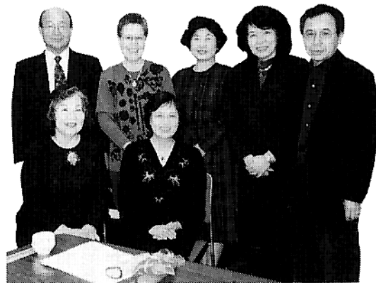
▲和歌・短歌の会のメンバー

昨年の三月に三十名の会 員を募って発足し二年目の 活動に入りました。土日の 開催なら参加出来るという 声が多いのですが私の仕事 上、都合がつかず現在毎月 第三木曜日の午後一時三十 分より三時三十分まで池袋 勤労福祉会館5F第一音楽 室で会費千五百円で開催し ております。参加者が思っ たより少ないのですが詩が 好き吟ずるのが好きな人達 ばかりなので和やかな楽し い会に育っております。毎 回二曲ずつマスターしてい ただきます。毎月一回、三 ヶ月先までの日程をハガキ でお知らせします。私が自 社ビルの上階の多目的教室 で詩吟教室を週一回開催 しております。その時此の会と 合流する予定です。秋には