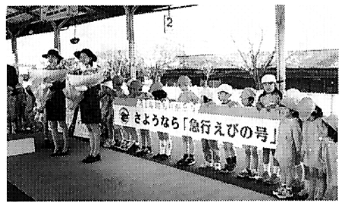
▲JR小林駅で、最後の急行えびの号

表彰を受けた、大太鼓踊りは、四〇年以上昔から南方神社(西長江浦)に伝わるもので、毎年八月二八