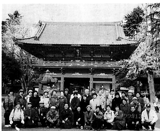
▲忘年ウォーク(昨年12月)の根津神社

日 時 五月二十四日(水) 川崎19時30分発、二十八日 川崎16時30分着 (日)川崎16時30分着 船中2泊と須木村栗の山 里「かるかや」2泊 費用 往復のカーフェリ 一代、二日間の宿泊代と食 事代(6食)、移動用バス代、