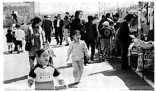
▲楽しいにぎわいの「のじりこびあ、市