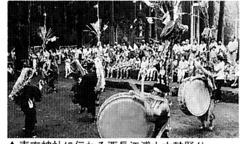
▲南方神社に伝わる西長江浦太鼓踊り