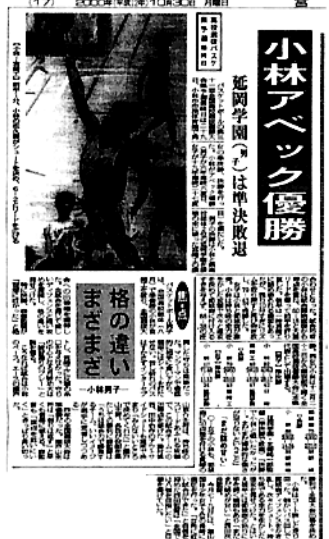
小林高校の優勝伝える 宮崎日日新聞の記事