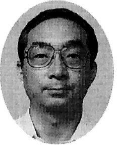
林高校の中に脈々と流れています。