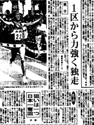
1区から力強く独走 男子 22分 女子 18分 日本一奪回

去る十月二十九日に行われた「全国高校バスケットボール選抜優勝大会」の宮崎県予選で、小林高校が六年度連続で男女アベック優勝を挙げ、十二月二十四日(日)14時30分 東京体育館(日)11時30分 東京体育館(日)11時30分 東京体育館(宿泊先)日本青年館(新宿区霞丘町・03-3401-5010)に行われ、母校が男女とも優勝し、十二月二十四日に行われる全国大会へのアベック出場が決まりました。県予選は気温・湿度とも高い厳しいコンディションの中、男子は2時間8分03秒の好タイムで優勝し、全国トップレベルに肩を並べる水準になっています。「復活小林」を目指した京都・都大路での快走を期待して、桜萩会からも応援を送りましょう。(会報部)