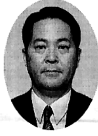
〈故郷担当・特別幹事に永迫さん〉