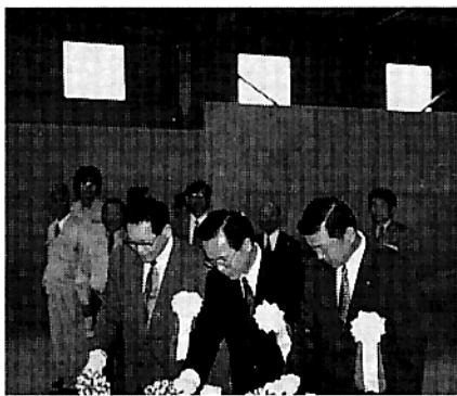
野尻町有機センター新築稼働記念式典でのテーブルカット

野尻町とJAこぼやし、町内の畜産農家が出資して、第三セクター『株式会社野尻町有機センター』を設立しました。運営を始めるにあたり野尻町有機センター新築稼働記念式典が十月六日現地で行われました。