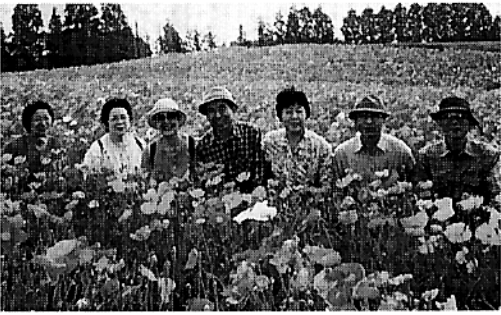
生駒高原のポピーの中で