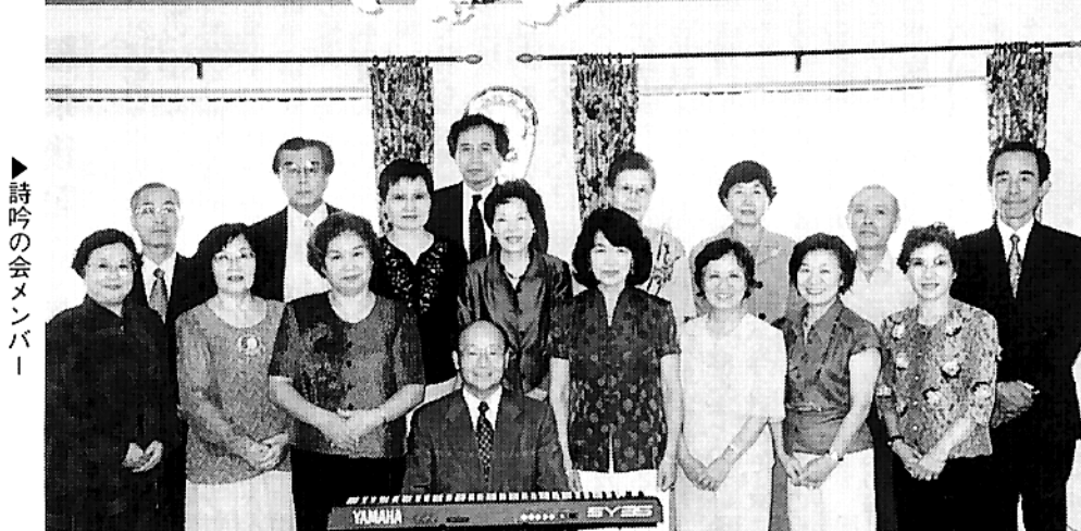
▶詩吟の会メンバー

私共の「和歌、短歌を吟 ずる会」も、お陰様で固ま ってきました。最近、和歌、 短歌だけでなく、詩吟(漢 詩)も習いたいとの要望が 多くなりましたので、十月 より第一、第三木曜日の月 二回実施する事になりました。 去る六月に詩吟の会で中 国の上海、蘇州へ旅行しま した。かの有名な寒山寺で 朗々と吟じ、想い出多い楽 しい旅でした。 又、九月には巨泉流吟詠 会の全員による温湯会を実 施し、日頃の練習の成果を 発揮して盛大な会となりま した。