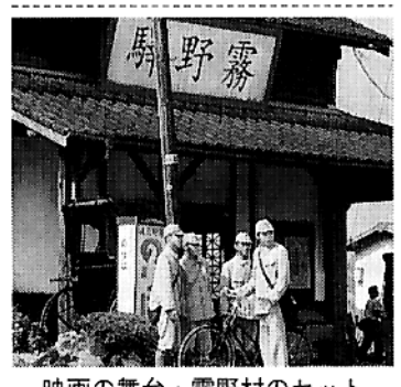
映画の舞台・霧野村のセット