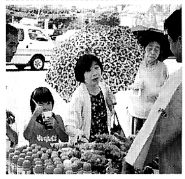
尼崎市での小林市産直物産フェア