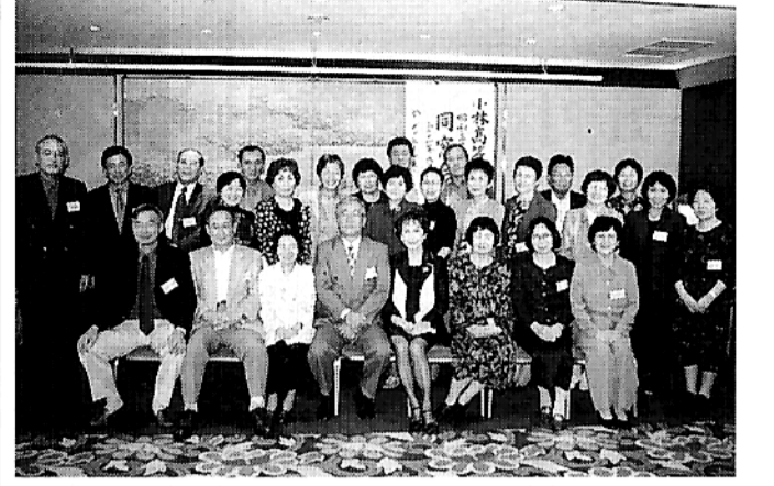
昭和35年卒同窓会、9月23日、キャピタル東急ホテルにて

昭和35年卒業生(第12回)の同窓会を還暦祝を兼ねて、去る九月二十三日から二十四日にかけて一泊二日の日程で開催しました。 当初は全国の同窓生に呼びかけの全国版を計画しましたが、十一月に小林在住の同窓生によるシーガイアでの同窓会の計画がある事が分かり、規模を縮小しての関東地区在住者を中心とした計画になりました。 それでも九州、関西地区からも駆けつけ、総勢28名による開催となりました。 当日は東京駅に集合して貸切バスで都内観光へと、42年前の青春を思い出しな 先ず、代表幹事の挨拶、物故者への黙祷、乾杯、卒業後の足取り、近況報告、記念撮影、カラオケ等の4時間の大会となりました。 宴会が終わった後も喫茶店の閉店時間まで語り合 い、それでも終わらず部屋に入って語り合...翌日、何時に寝たか聞きま す、殆どが「2時、3時の連発で再会の喜び、感激を美酒と共におな一杯にしたよう です。最初の出会いが緊張のせいか、年相応かなと、正直なところ思つたようです。 次第に緊張が取れ話話が弾むにつれて目がいきいきと輝くのを感じました。別れの時の目はま