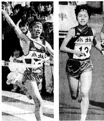
駅伝部、県大会での力走！ (H13年11月5日付宮崎日日新聞より)

小林高校宿泊先：日本青年館(新宿区霞丘町・TEL03-3401-0101) 一方、十一月四日に行われた全国高校駅伝の宮崎県大会では、男女とも見事優勝を果たしました(アベック優勝は3年連続8度目)。