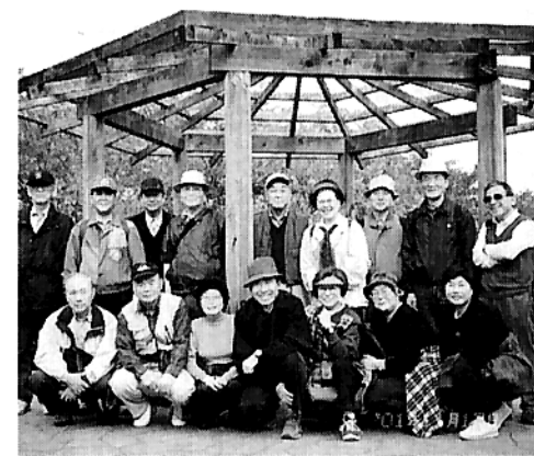
東京23区内で一番高い箱根山(44.6m)の頂上にて(ビルの谷間にあります)

同じコースを歩かないで、初めての景色で新しい感動を求めて7年間があつたと言ふ間に過ぎ去りました。8年目を迎えて、もう都心では初めての道だけでコース設定をすることに無理があることを知りまし