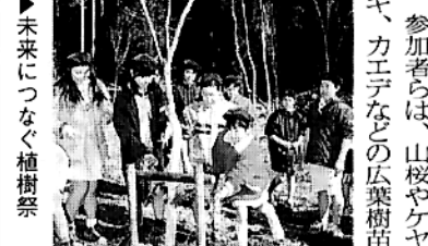
◆未来につながる植樹祭

◇須木村 十数年の交流―友好村締結式 平成十三年十一月十一日(日)、小泊村と須木村による友好村締結式が東京都の第一ホテル両国にて開催されました。