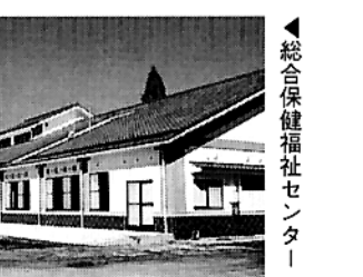
総合保健福祉センター

また、3つの温室が並ぶ展示見本園があり、亜熱帯の植物が展示されている大温室、乾燥地帯の植物を展示している中温室、それに寒冷地や高山の植物を展示している冷室などがありま また、温室の回りにはたくさんの菓草やハーブ、山野草、本県の在来種の系巻きアイコンなどが植えられています。